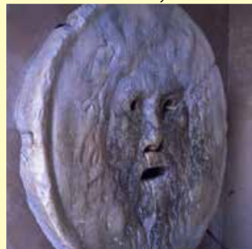
真実の口 / イタリア