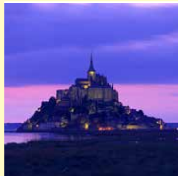
モン・サン=ミシェル / フランス