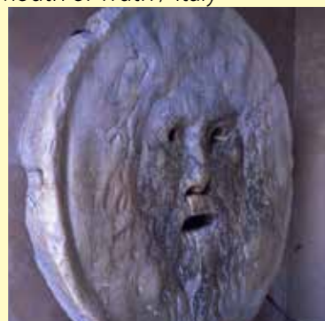
真実の口 / イタリア