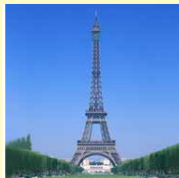
エッフェル塔 / フランス