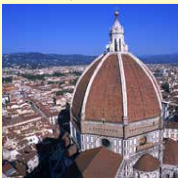
フィレンツェ / イタリア