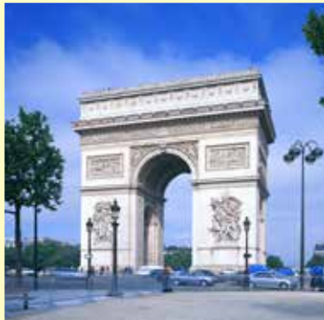
凱旋門 / フランス