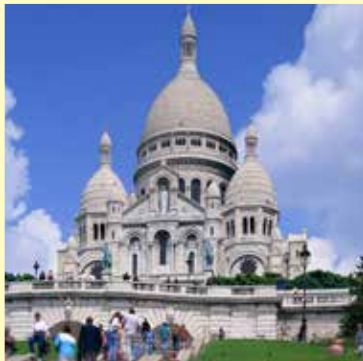
サクレ・クール寺院 / フランス